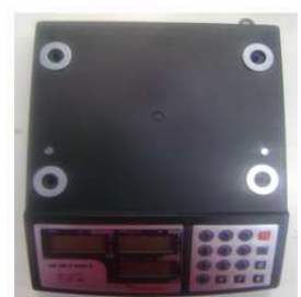
4 arruelas na parte superior